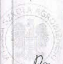
PROF. ROMAN ENGLER

The programme consists of 6 modules and is awarded 6 ECTS credits (180 hours) from 10.05.2021-18.06.2021