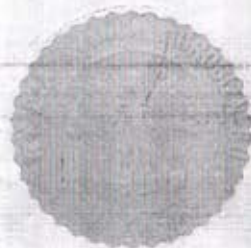
PHD IRENEUSZ ŻUCHOWSKI