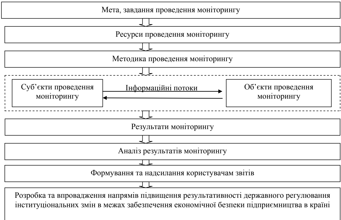
Рис. 3. Механізм здійснення моніторингу впливу державного регулювання інституціональних змін на СЕБП в Україні

підприємництва, що застосовується в ЄС з 2008 року. Окремо наведено механізм проведення такого виду моніторингу, в межах якого визначені наступні його складові: мета; завдання; суб'єкти; об'єкти; умови та принципи здійснення; функції; види; етапи, індикатори та розробка і впровадження напрямів підвищення результативності здійснення (рис. 3).