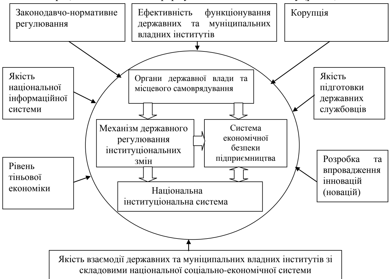
Рис. 2. Чинники-каталізатори, що впливають на формування механізму державного регулювання інституціональних змін

В межах дослідження механізмів державного регулювання інституціональних змін в умовах трансформації економіки України визначено сутність та ознаки наукової категорії «механізм», сформульовано авторські визначення термінів «механізм державного регулювання» і «механізм державного регулювання інституціональних змін», наведено і надано характеристику факторів – каталізаторів, що впливають на формування такого механізму (рис. 2).