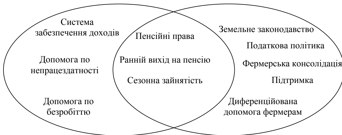
Рис.1.Інструменти системи соціального захисту сільського населення

Досліджуючи питання соціального захисту ЄС у сільському господарстві, встановлено, що Спільна аграрна політика здійснюється не лише через регулювання ринків сільськогосподарської продукції, квотування виробництва, фінансову підтримку фермерів та їхню консолідацію, розвиток передової практики господарювання й підтримку структурних змін у аграрному секторі, використання інструментів системи соціального захисту населення ( рис.1).