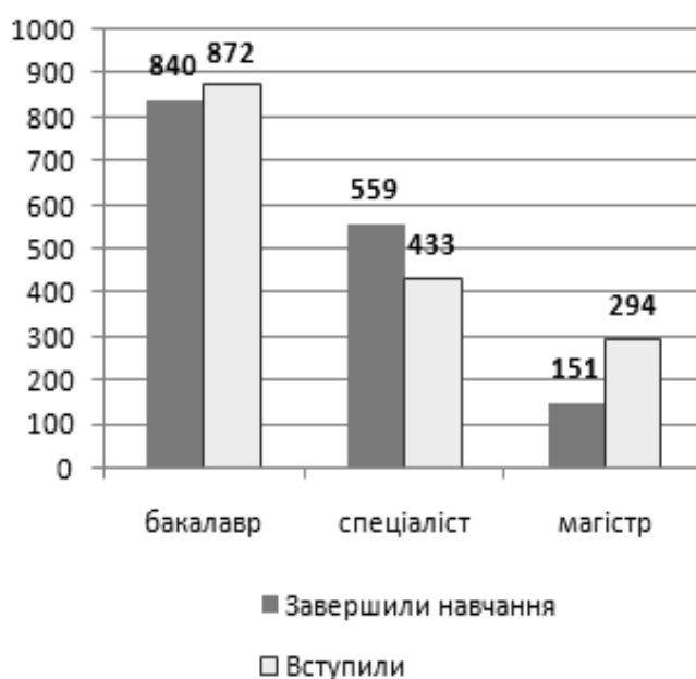
Рис. 1. Динаміка чисельності студентів у 2015 р.

План державного замовлення в університеті за всіма рівнями, напрямками підготовки та спеціальностями виконаний на 100% в обсязі 851 особа, в т.ч. – «Бакалавр» – 417 осіб, «Спеціаліст» – 324, та «Магістр» – 110 осіб.