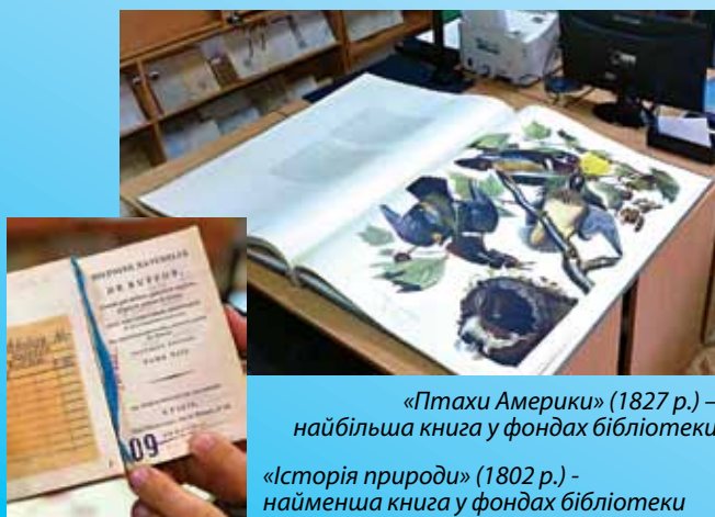
«Птахи Америки» (1827 р.) – найбільша книга у фондах бібліотеки