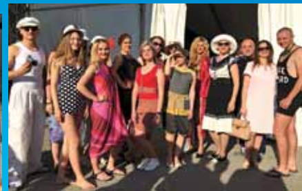
Акторська майстерність студентів