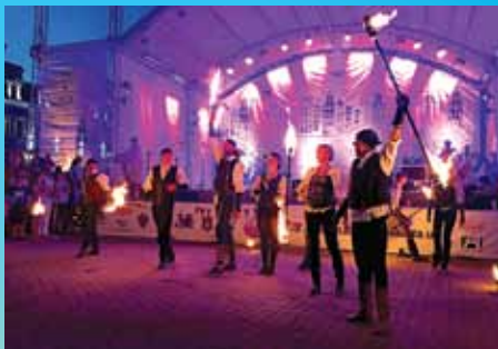
Майстер-клас від співробітників ПДАТУ на РетроФест