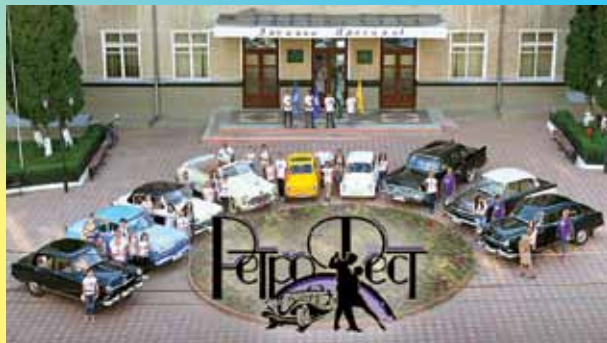
Виставка ретроавтомобілів біля головного корпусу університету

Колектив ПДАТУ прийняв активну участь у Міжнародному фестивалі «РетроФест».